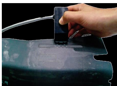
3MA-Gerät und 3MA-Prüfung

(*) Mikromagnetische multiparametrische Mikrostruktur- und Spannungs-Analyse